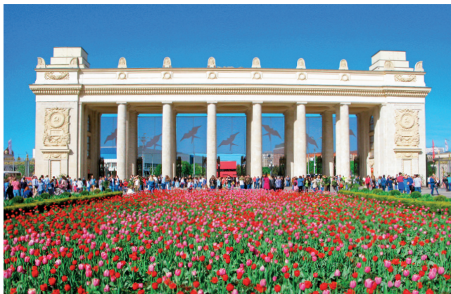
▲ Парк Горького

м. Октябрьская, м. Парк культуры ул. Крымский Вал, 9 park-gorkogo.com