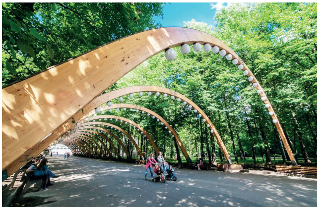
▲ Аллея арок в «Сокольни- ках»

м. Сокольники ул. Сокольнический Вал, 1, стр. 1 park.sokolniki.com