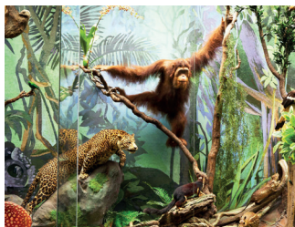
▲ Государственный Дарвиновский музей

м. Академическая, ул. Вавилова, 57 darwinmuseum.ru