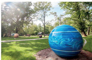
▼ Парк «Сокольники»

Н азвание «Сокольники» происходит от слова «сокол» и связано с царской соколиной охотой, которая велась в этом лесу с XV века. «Сокольники» и теперь крайняя часть леса, уходящего на северо-восток от Москвы. В 1931 году Сокольническую рощу объявили городским парком. Однако «лесное» в «Сокольниках» продолжает свою историю.