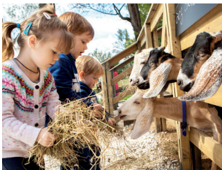
▲ Городская ферма

В Москве иногда не хватает моря. Действующий океанариум на ВДНХ с успехом компенсирует эту нехватку. «Москвариум» оборудован по последнему слову океанографии. Более 8 тысяч ви-