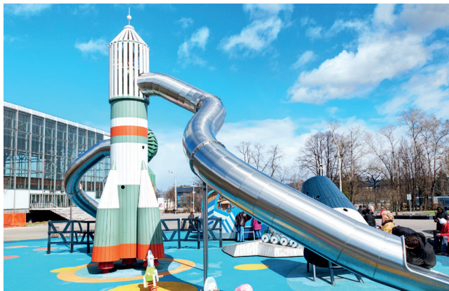
▲ Детская площадка «Космос»

Современные дети часто интересуются, как жили в СССР. Узнать СССР с его самой привлекательной стороны и показать его детям можно здесь. ВДНХ — город мечты, возникший в 1939 году как образ светлого будущего.