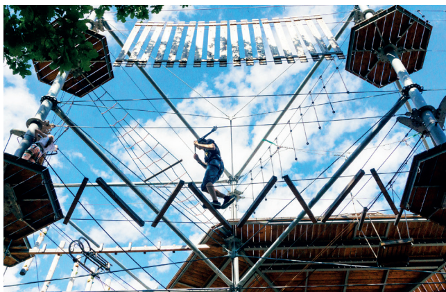
▲ Высотный веревочный парк SkyTown

м. Медведково, пр-д Шокальского, 52 ruskart.ru