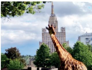
▲ Жираф на фоне московской высоты

Зоопарк делится на старую и новую территории. На старой открыт слоновник с двухэтажной смотровой площадкой. На его цокольном этаже находится интерактивный Музей слонов , где дети ознакомились не только с характером и привычками самого большого животного, но и потрогают его хобот и бивни. Вы увидите множество диких кошек, например быстрых гепардов. Напротив вольера с гепардами расположен большой Дом жирафа , над которым в старейшем здании «зверополиса» находится Музей истории Московского зоопарка . Там можно