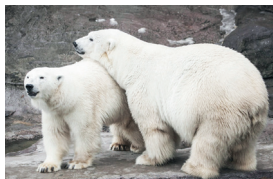
▲ Белые медведи

Территория огромна, и для того, чтобы обойти все вольеры и павильоны, понадобится целый день, а может, даже и не один. Но если ваши дети утомятся, вокруг множество скамеек. В Московский зоопарк можно войти как через главный вход, так и через новую территорию с Большой Грузинской или с Садового кольца.