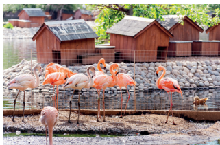
▼ Розовые фламинго

В одном из старейших зоопарков Европы, расположенном на огромной территории в 26 га, звери так же, как и люди, чувствуют себя хорошо. Условия приближены к их естественной среде обитания. Это место, где есть возможность поддерживать и сохранять редкие вымирающие виды животных. Благодаря этому Московский зоопарк принял участие