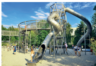
◀ Детская площадка

Зимой в парке Горького открыты не только популярный городской каток, но и настоящая хоккейная площадка.