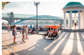
▲ Набережная в Парке Горького

том, звуком, высотой и глубиной, разными фактурами, формами и размерами. Здесь есть уникальные «Мегакачели» — 29 качелей со всевозможными видами вращения. Площадка доступна для детей с различными формами инвалидности.