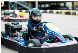
Картинг Monaco RRT Karting Club ▶

ко в летнее время в хорошую погоду. В каждом парке есть несколько маршрутов, которые можно пройти по отдельности или объединить в большой маршрут.