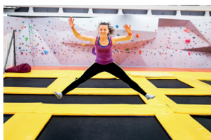
▲ Батутный центр «Небо»

Высотный веревочный парк Sky Town — сооружение высотой 16 метров на территории