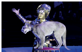
▼ Большой Московский цирк

Театр кукол им. С. В. Образцова — крупнейший в мире театр кукол, созданный в 1931 году. Здесь работает уникальный Музей театральных кукол, где собраны самые знаменитые куклы со всего мира. Металлические часы, украшающие фасад — визитная карточка как для театра, так и для города.