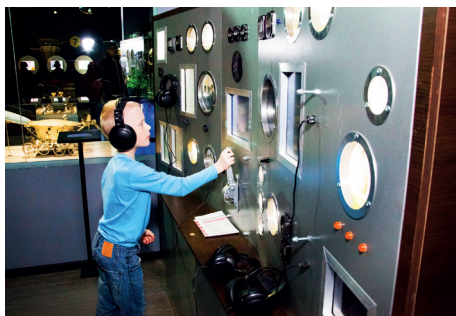
◀ Пульт управления подводной лодкой

Международный проект, реализующий при участии крупных корпораций детскую мечту о маленькой стране, в которой всё создано для детей. Город с настоящими домами, улицами, автомобилями, социальными службами, собственной валютой и так далее. Никогда ещё детские игры во взрослую жизнь не были столь реалистичными. Но это не чистое развлечение, а обучающие игры, дающие практические навыки и знания об окружающем мире. Ваши дети могут попробовать больше 100 различных профессий. В Москве на территории ТЦ «Авиапарк» «Кидзания» — это парк площадью 10000 кв. метров. Купите ребёнку билет на рейс Москва — «Кидзания» и отправьте его поработать и отдохнуть в эту замечательную страну.