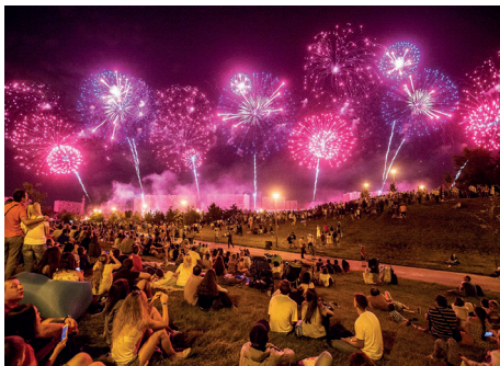
◀ Фестиваль пиротехнического искусства

«Спасская башня» возродила одну из красивейших традиций — выступления военных оркестров в парках и скверах