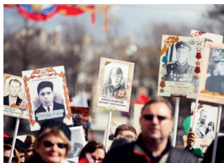
▲ «Бессмертный полк»

Москва — город Победы. На Красной площади прошёл первый парад в июне 1945 года. Самую современную военную технику в Москве можно увидеть уже в апреле, когда начинаются интенсивные репетиции. Авиацию в день парада идеально рассматривать с Ленинградского проспекта, Тверской улицы и Раушской набережной. Праздник Победы ( may9.ru ) также отмечается в парках, на Белорусском вокзале, на Поклонной горе. Акции «Бессмертный полк» всего 5 лет, но она уже стала самой популярной и массовой в России. В ней может принять участие каждый, кто хочет отдать дань памяти родственникам-победителям или почтить павших воинов. Наконец, вечерний праздничный салют, залпы которого также неизменно звучат в Москве с 9 мая 1945 года.