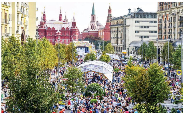
▲ улица Тверская