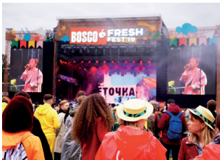
▲ Bosco Fresh Fest

В августе любителей джаза ждет праздник — Московский международный фестиваль «Джаз в саду «Эрмитаж»». За 20 лет из небольшого городского праздника он превратился в крупнейший джазовый open-air форум. Теперь это ещё и приятное развлечение для всей семьи: джаз-лекторий, танцевальные мастер-классы, творческие лаборатории, детская фан-зона и фуд-корт. При этом всё бесплатно!