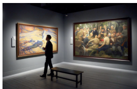
▲ «Ночь музеев»