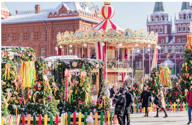
▲ Праздник Масленицы