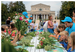
▲ «Цветочный джем»

Летом, когда вокруг так свежо, торжествуют зрение и обоняние. Международный фестиваль «Цветочный джем» ( moscowflowerfest.ru ) быстро завоевал популярность среди москвичей и туристов, и теперь проекты, созданные ландшафтными дизайнерами из разных стран мира, украшают город в течение всего лета. Каждый год у конкурса своя тема. В 2018 это были «Яркие цвета», в 2019 – «Летние сады Москвы». Но, помимо конкурса, на сотнях площадок действуют бесплатные мастер-классы для взрослых и детей, знакомящие с азами ландшафтного дизайна, ботаники, химии и флористики. На них можно создавать авторские букеты и цветочные