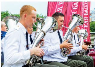
▲ «Спасская башня»

Московский международный фестиваль «Круг света» ( lightfest.ru ) — это сказка, которую вот уже несколько лет наблюдают москвичи и гости