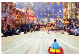
▲ «Путешествие в Рождество»

дество» — это около сотни площадок в центре города, округах и парках, спектакли и концерты, ледяные горки и коньки, рождественские угощения и сувениры.