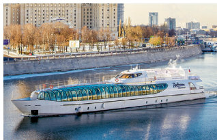
▲ Яхта Флотилии «Рэдиссон Ройал»

За короткое время получить яркое впечатление от города можно, купив билет на знаменитый красный двухэтажный автобус CitySightseeing ( city-sightseeing.ru ). Через окно или с крыши даблдекера вы увидите все самое главное и интересное в городе и, конечно, услышите всё о московских достопримечательностях на знакомом языке через мультязычный аудиогид. А система hop-on hop-off позволит выходить из автобуса и заходить в него там, где вам удобно, и столько раз, сколько вам нужно.