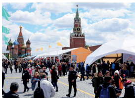
◀ Фестиваль «Красная площадь»

Книга в печатном формате, о конце которой было принято говорить в 1990-е, в последние годы возвращает позиции. Красная площадь стала местом модного и масштабного книжного события. Одноименный фестиваль, приуроченный ко дню рождения А. С. Пушкина, проходит ярко и весело. Это не только повод купить редкую или давно желанную книгу, но и возможность послушать живое выступление современных поэтов и писателей в самом сердце столицы.