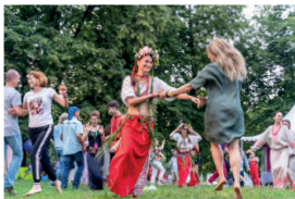
▲ «Усадьба Jazz»

Bosco Fresh Fest проходит в Москве с 2012 года. Ранее домашними площадками фестиваля служили сад «Эрмитаж» и ВДНХ, а теперь «Фреш Фест» овладел Московским дворцом пионеров на Воробьевых горах. В следующем году он появится где-то в другом месте. Самый модный и непредсказуемый молодежный фестиваль.