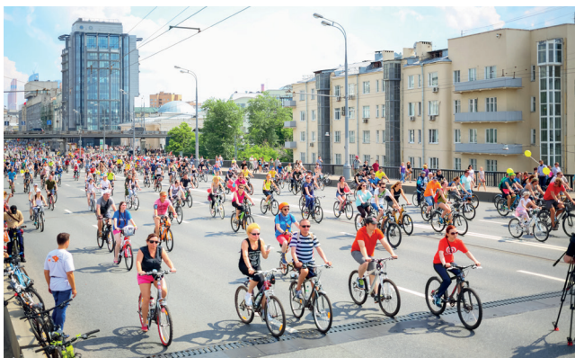
▲ Московский велопарад

Н овейшая история московских велопарадов насчитывает всего восемь лет: первый велопарад Let's bike it! состоялся в 2012 году. Однако за это время он успел, по общему признанию, стать лучшим спортивно-массовым событием. Миссия современного велосипедного движения в Москве — развитие велосипедной инфраструктуры и безопасность на дорогах. Московский велопарад ( i-bike-msk.ru ) проходит несколько раз в год — зимой, весной и летом.