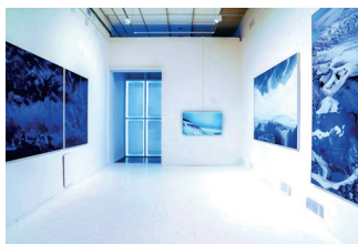
▼ Биеннале современного искусства

Впервые партнёром Московской биеннале современного искусства ( moscowbiennale.art ) выступила международная институция – музей Альбертина (Вена, Австрия), коллекции которого привезут в столицу. Основной проект 8-й Московской международной биеннале современного искусства пройдет в Государственной Третьяковской галерее.