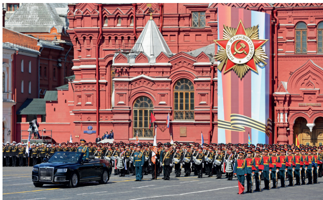
▲ Парад на Красной площади

Москва — город Победы. На Красной площади прошёл первый парад в июне 1945 года. Самую современную военную технику в Москве можно увидеть уже в апреле, когда начинаются интенсивные репетиции. Авиацию в день парада идеально рассматривать с Ленинградского проспекта, Тверской улицы и Раушской набережной. Праздник Победы ( may9.ru ) также отмечается в парках, на Белорусском вокзале, на Поклонной горе. Акции «Бессмертный полк» всего 5 лет, но она уже стала самой популярной и массовой в России. В ней может принять участие каждый, кто хочет отдать дань памяти родственникам-победителям или почтить павших воинов. Наконец, вечерний праздничный салют, залпы которого также неизменно звучат в Москве с 9 мая 1945 года.