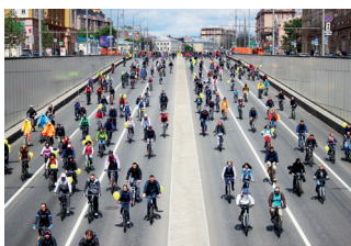
▲ Московский велопарад

Н овейшая история московских велопарадов насчитывает всего восемь лет: первый велопарад Let's bike it! состоялся в 2012 году. Однако за это время он успел, по общему признанию, стать лучшим спортивно-массовым событием. Миссия современного велосипедного движения в Москве — развитие велосипедной инфраструктуры и безопасность на дорогах. Московский велопарад ( i-bike-msk.ru ) проходит несколько раз в год — зимой, весной и летом.