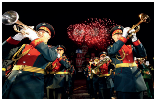
▲ «Спасская башня»

Джаз в саду «Эрмитаж». Старейший московский джазовый фестиваль