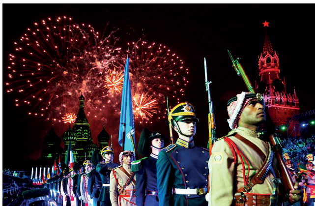
▲ «Спасская башня»

« М осковские сезоны» ( moscowseasons.com ) — городские фестивали в каждое время года. Праздник Рождества — всего один день, Рождественские каникулы — неделя, а фестиваль «Путешествие в Рождество» в рамках «Московских сезонов» длится 31 день! За это время можно забыть обо всём, встречая Рождество и Новый год в самой зимней и самой сказочной столице Европы. «Путешествие в Рож-