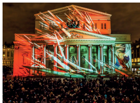
▲ «Круг света»

столицы. Светодизайнеры, мастера мейкинга и профессионалы в области 2D- и 3D-графики творят настоящие чудеса, и Москва, которая и так красива, превращается по вечерам в небесный град.