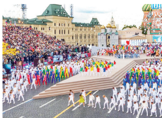
▲ Красная площадь

Д ень города Москвы — главное событие года для горожан. Отмечается в первую или вторую субботу сентября. С каждым годом праздник становится всё ближе к каждому москвичу. Теперь он приходит почти в каждый двор. Нужно просто выйти из дома и сделать пару шагов к ближайшей праздничной площадке. Там ждут большие игровые зоны — на них можно посостязаться всей семьей; мастер-классы домашнего декора и дачной ботаники; рестораны и закусочные под открытым небом, где можно отведать шашлык и 160 сортов мороженого; ярмарка, на которую 40 регионов России привозят свои самые вкусные гостинцы, а также соревнования цветоводов-любителей, в которых может принять участие любой желающий и выиграть один из массы призов. По традиции завершает День города праздничный салют.