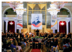
▲ Международный конкурс им. П. И. Чайковского

Международный конкурс им. П. И. Чайковского — конкурс молодых академических музыкантов, проводимый с 1958 года с периодичностью раз в четыре года. Финальные прослушивания участников в Большом зале Московской консерватории — значительное событие в мировой классической музыке, а быть лауреатом конкурса Чайковского чрезвычайно почётно.