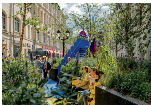
▲ «Цветочный джем»

композиции, подготовиться к работам в саду или на огороде, познакомиться с модными тенденциями в ландшафтном дизайне или научиться тому, как создавать объемные проекты загородных домов и как правильно высаживать зелень. Плюс, конечно, бесплатные экскурсии по паркам, садам и огородам!