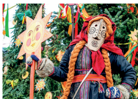
▲ Праздник Масленицы

Раньше он совпадал с весенним равноденствием и отмечался 20 или 21 марта. Аналоги праздника есть и в других странах. Это кельтский Белтайн, кёльнский Фастеловенд (Fastelovend), майнцский Фассенахт (Fassenacht). В Москве праздник Масленицы включен в программу «Московские сезоны», и гости фестиваля смотрят праздничные представления, участвуют в соревнованиях и конкурсах и, конечно, едят очень много блинов.