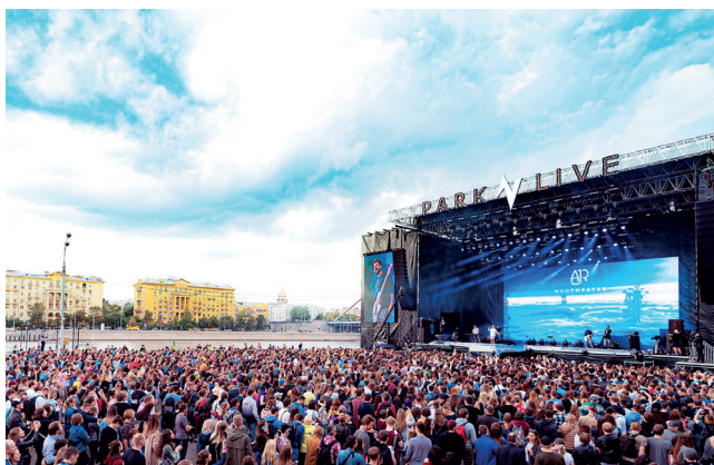
▲ Park Live