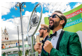
▲ «Московская весна A Cappella»

Слушайте музыку, вдыхайте аромат и наслаждайтесь вкусом «Московских сезонов»!