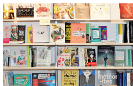
Ярмарка Non/fiction ▶