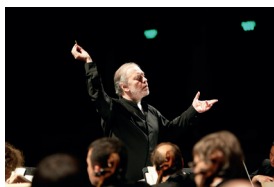
▲ Пасхальный фестиваль

столицы. Светодизайнеры, мастера мейкинга и профессионалы в области 2D- и 3D-графики творят настоящие чудеса, и Москва, которая и так красива, превращается по вечерам в небесный град.