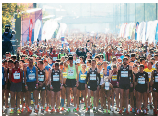
▲ Абсолют марафон

Летний зеленый марафон «Бегущие сердца» ( runninghearts.ru ) стартует на Васильевском спуске. Этот забег благотворительный: оплату участников переводят на счет фонда помощи детям, а все артисты выступают бесплатно.