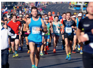
▲ Московский полумарафон

В мае в центре Москвы проводится Московский полумарафон ( moscowhalf.runc.run ) (выбирается один из трех маршрутов — на 5, 10 и 21,1 километра по живописным набережным Москвы-реки: Лужнецкой, Фрунзенской, Пречистенской, Кремлевской, Раушской и, наконец, Космодамианской). Те, кто выбирает путь покороче, бегут по Лужнецкой, Новодевичьей и Саввинской набережным. Полумарафон также проходит и в августе: это семейный праздник с бегом, фуд-кортом и музыкой. Маршрут обычный — это круг по набережным Москвы-реки.