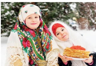
▼ Праздник Масленицы

Россия — зимняя страна, и переход от зимы к весне здесь радостное событие для всех