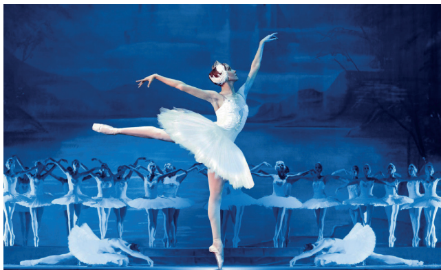
▲ Международный фестиваль балета