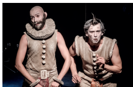
▲ «Золотая маска»

«Золотая маска» — российская национальная театральная премия и фестиваль. Фестиваль спектаклей, выдвинутых на соискание премии «Золотая маска» — это яркое зрелище, которое предъявляет профессиональному сообществу и широкому зрителю широкую картину российской театральной жизни. А она бьет ключом.