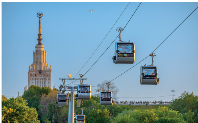
▲ Канатная дорога на Воробьевых горах