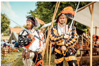
▲ «Времена и эпохи»

Международный военно-музыкальный фестиваль «Спасская башня» ( spasstower.ru ) — это музыкальный праздник с участием военных оркестров, фольклорных ансамблей и подразделений почетной охраны глав государств. Традиционно он завершается красочным парадом на Красной площади. Фестиваль приурочен ко Дню города Москвы. Но зато всё лето у вас есть прекрасная возможность бесплатно послушать популярные мелодии в исполнении военных музыкантов, а военные музыкальные школы отличает высочайшее качество исполнения.