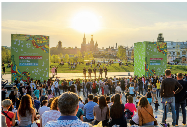
▼ «Московская весна A Cappella»

В есной москвичи и гости столицы превращаются в слух, потому что в самых неожиданных местах – в парках, на балконах домов, в фудмоллах, на курсирующих по Москве-реке теплоходах – конкурсанты со всего мира дают живые концерты. Это «Московская весна A Cappella» ( acappella.moscow ). Поскольку данный формат предполагает, что инструмент у исполнителя всегда с собой, почти любое городское пространство может «внезапно» превратиться в концертную площадку.